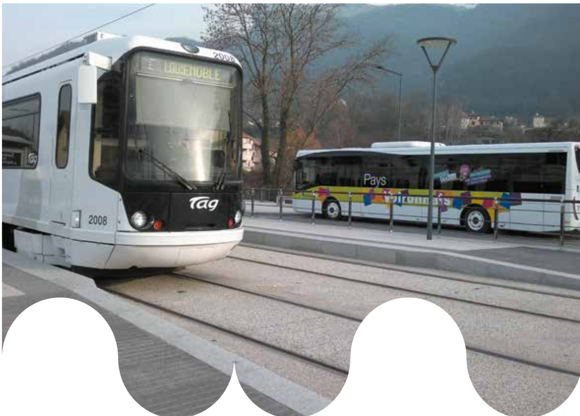
Interconnexion entre les lignes du SMTc et du Voironnais au pôle d'échanges de Fontanil Palluel