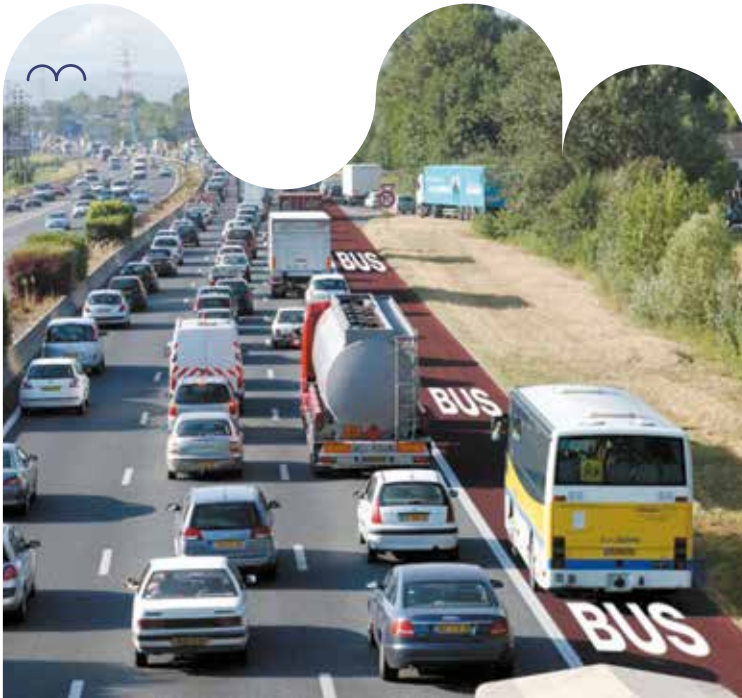
Voie réservée partagée sur l'A48 en direction de Grenoble