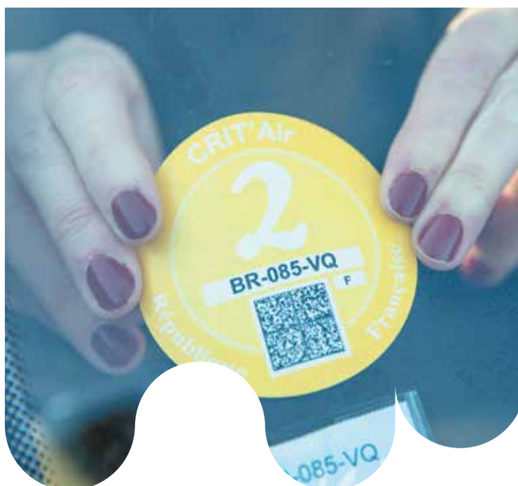
Vignette Crit'Air, certificat qualité de l'air, obligatoire pour circuler sur le ressort territorial du SMTC

Source: Lignes directrices OMS relatives à la qualité de l'air - Synthèse de l'évaluation des risques - Mise à jour mondiale 2005.